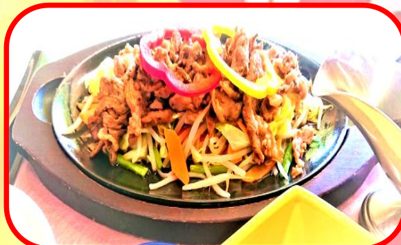
おつまみにラムの鉄板焼き 1,300円