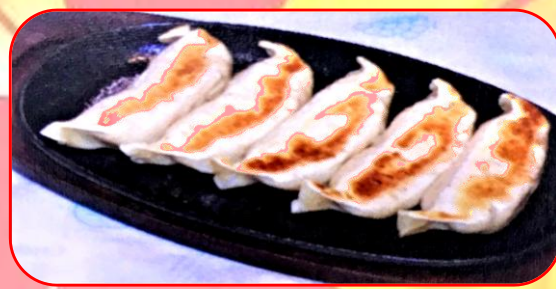
栗駒特選焼き餃子 720円