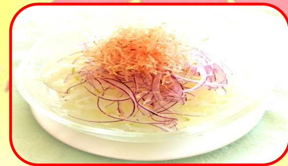
オニオンスライスサラダ 550円