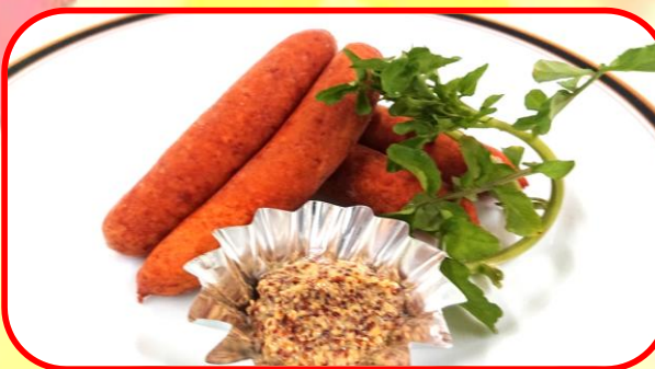
ウィンター盛合せ(粒マスタードで)800円