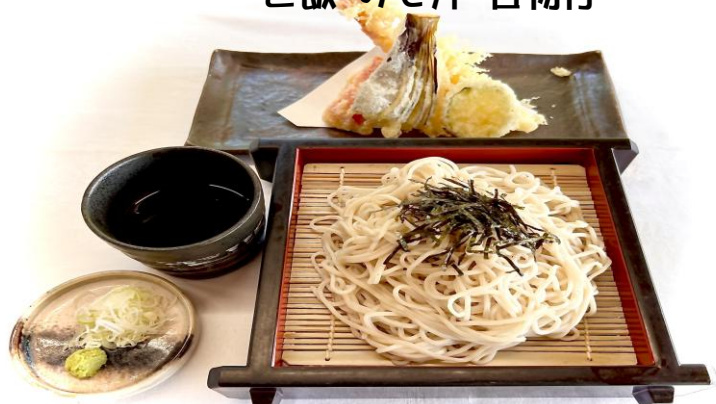
天ざるそば・うどん・・・1300円 温そばも出来ます