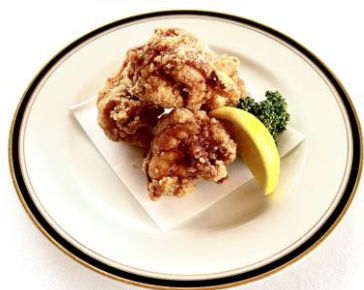
自家製たれ漬け鶏の唐揚げ・・・780円