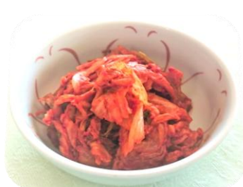
白菜キムチ・・・580円