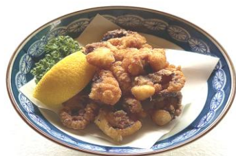
蛸のから揚げ・・・750円