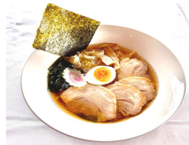
チャーシュー麺・・・1320円