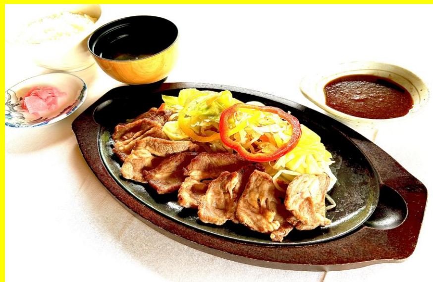
ラムの熱々鉄板焼き御膳・・・1750円