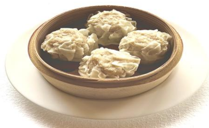
やわらか焼売・・・780円