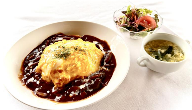
ふわふわオムライス(デミソース)・・・1330円