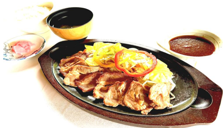
熱々ラムの肩ロース鉄板焼き・・・1750円 ご飯・みそ汁・香物付