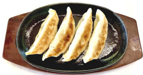
熱々ジャンボ餃子の鉄板焼き・・・650円