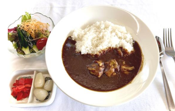
ビーフカレー・・・1350円