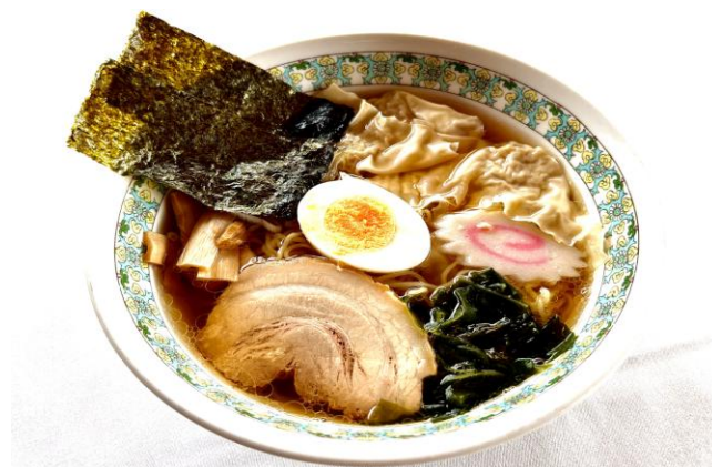
ワンタン麺(醤油)・・・1150円