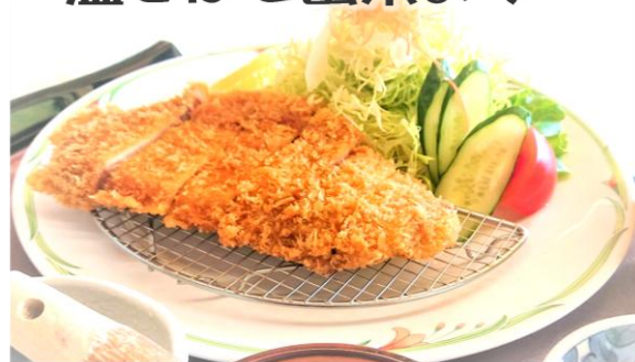
県産豚の豚カツ御膳・・・1650円 ご飯・みそ汁・香物付