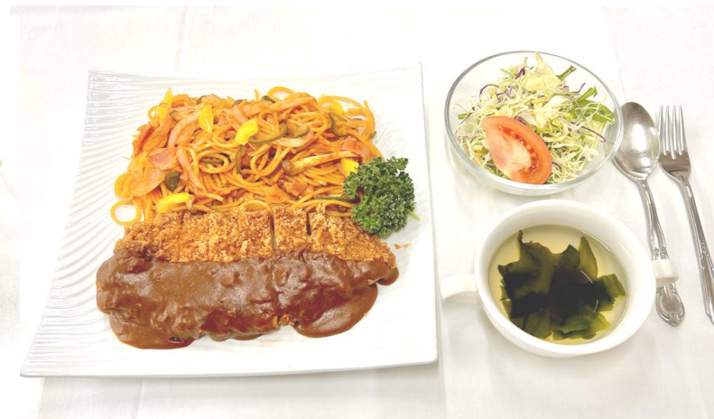
ナポリカツ・・・1450円