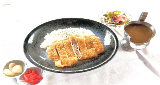
県産豚のかつカレーセット・・・1350円