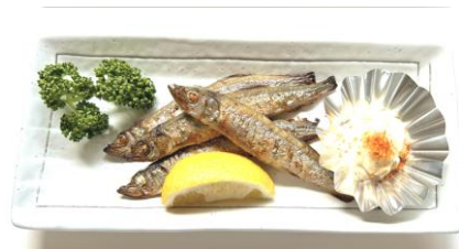
ししゃも焼き・・・640円