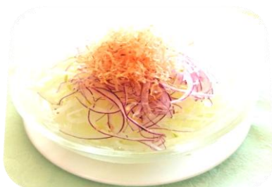
オニオンライスサラダ・・・580円